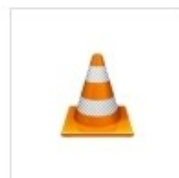
11 - Pesadilla 1.mp3